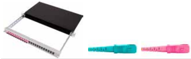
Vorkonfektionierter Patch-KEV SC/PC

Patch-/Patch-Panel für Breakout-/Fanout-Kabel mit Panel Auszug Alu schwarz / 2 Einführungen mit Brücken inkl. je 1x Blindplatte und Bürstenleiste / Inkl. Beschriftungsleiste und Montagematerial OMx = OM3 oder OM4