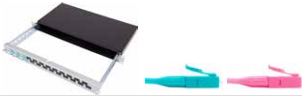
Vorkonfektionierter Patch-KEV LC/PC

Patch-/Patch-Panel für Breakout-/Fanout-Kabel mit Panel Auszug Alu schwarz / 2 Einführungen mit Brücken inkl. je 1x Blindplatte und Bürstenleiste / Inkl. Beschriftungsleiste und Montagematerial OMx = OM3 oder OM4