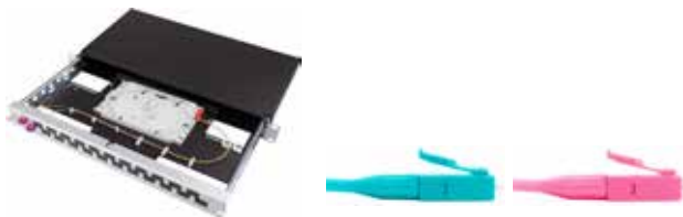
Vorkonfektionierter Spleiss-KEV LC/PC

Spleiss-/Patch-Panel mit Spleisskassettenhalter ausziehbar inkl. Spleisskassetten, ANT/SMOUV Halter und Spleisssschutze Alu Schwarz / 2 Einführungen mit Brücken inkl. je 1x Blindplatte und Bürstenleiste Inkl. Beschriftungsleiste und Montagematerial OMx = OM3 oder OM4