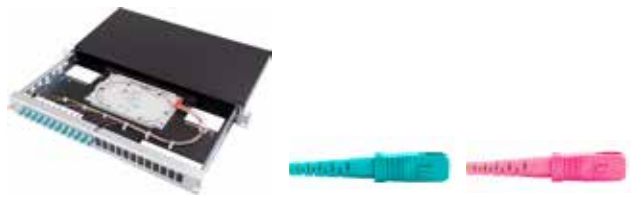
Vorkonfektionierter Spleiss-KEV SC/PC

Spleiss-/Patch-Panel mit Spleisskassettenhalter ausziehbar inkl. Spleisskassetten, ANT/SMOUV Halter und Spleisssschutze Alu Schwarz / 2 Einführungen mit Brücken inkl. je 1x Blindplatte und Bürstenleiste Inkl. Beschriftungsleiste und Montagematerial OMx = OM3 oder OM4