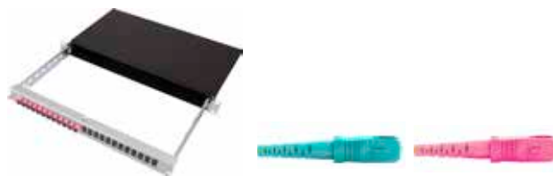
Vorkonfektionierter Patch-KEV SC/PC

Patch-/Patch-Panel für Breakout-/Fanout-Kabel mit Panel Auszug Alu schwarz / 2 Einführungen mit Brücken inkl. je 1x Blindplatte und Bürstenleiste / Inkl. Beschriftungsleiste und Montagematerial OMx = OM3 oder OM4