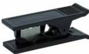
speed pipe Schneider klein

Rohrschneider, auch geeignet zum Schneiden von FOPT-Röhrchen