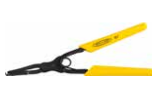
FACC-IET Montage-Zange, 80860

Zum einfachen Ein- und Ausstecken von FO Steckern in Patchfeldern, geeignet für Standard & SFF Stecker