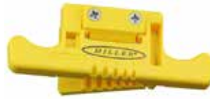
MSAT 5 - 80930