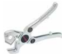
speed pipe Schneider Zange

Rohrschneider zum spannlosen und rechtwinkligen Schneiden von Einzelrohren