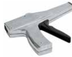
HANDSPANNWERKZEUG MK 3

Kabelbinder-Zange Bindebreite: 2.0-4.8mm Bindestärke: max. 1.5mm