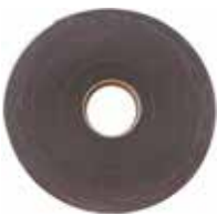
Caoutchouc cellulaire protection des câbles

Largeur Numéro d'article 10mm 315212-500 25mm 000500