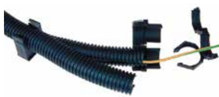
TUBE DE PROTECTION RAINURÉ

Variante Numéro d'article 2 x 12mm 990179-014 2 x 14mm 316408-215 4 x 20mm 990179-420