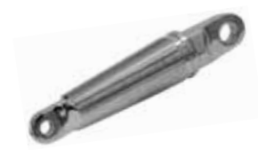
PULLING EYES JM-IPE