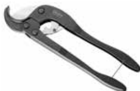
Pince à couper les multitubes

Pince à couper les multitubes SRV & SRV-G jusqu'à 75mm