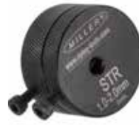
STR STEEL TAPE REMOVER