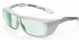
Lunettes de protection laser pour application de télécommunication

Monture 38, à porter directement et pour les porteurs de lunettes