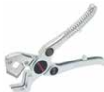
Pince à couper speed pipe

Pince à couper pour une découpe propre et droite pour tubes unitaire