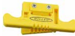
MSAT 5 - 80930

Outil d'ouverture longitudinale pour tube