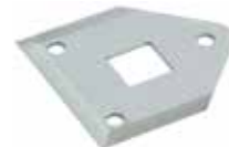
Lame de rechange pour pince à couer speed pipe

Lames de rechange pour pince à couper speedpipe®