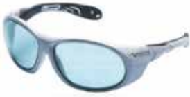
Lunettes de protection laser pour application de télécommunication