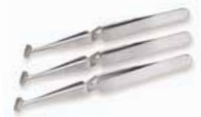
PINCETTE A SOUDER AWG

Fermeture automatique des pinces et haute conductivité thermique