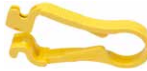
FTS - 80980