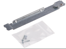
UMS Holder für Splitter